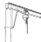
Schwenkkrane bis 6,3 t