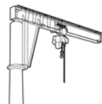
Schwenkkrane bis 6,3 t