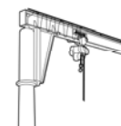
Schwenkkrane bis 6,3 t