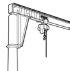
Schwenkkrane bis 6,3 t