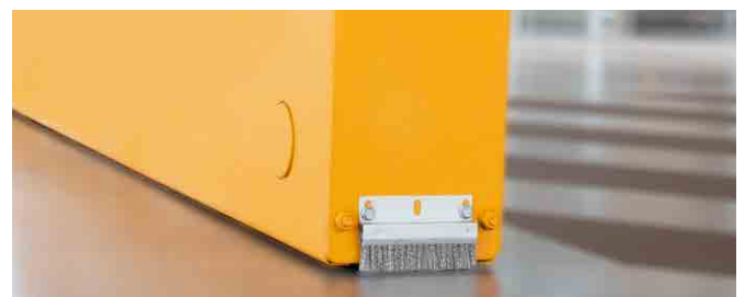
Bodenrollen ohne Führungsschiene