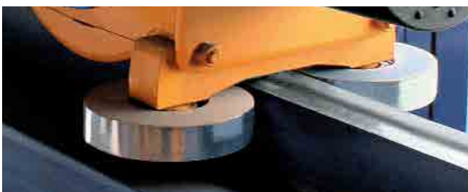
Führungsrollen an der oberen Kranbahn